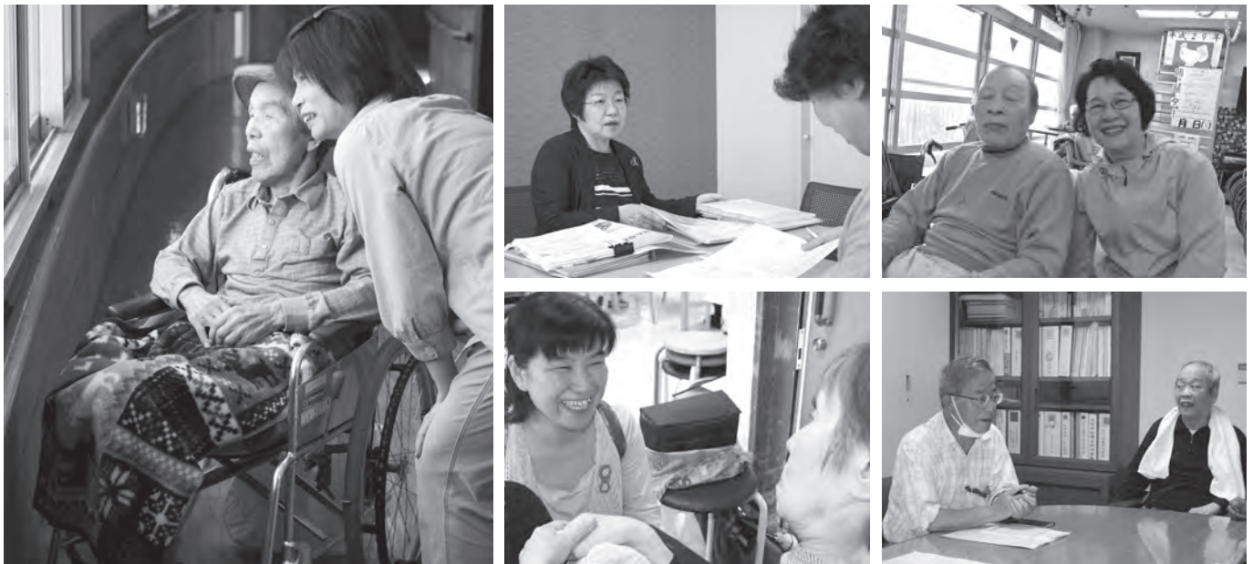
尾張東部圏域で活動する市民後見人の実際の活動風景